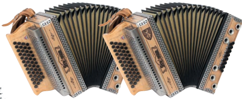
Erle ohne Wappen