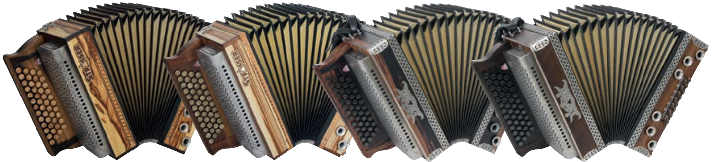
Chen Chen Tigerwood