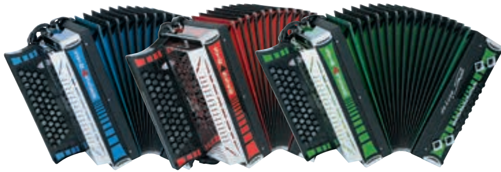
De luxe SE