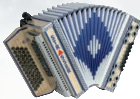
De luxe E